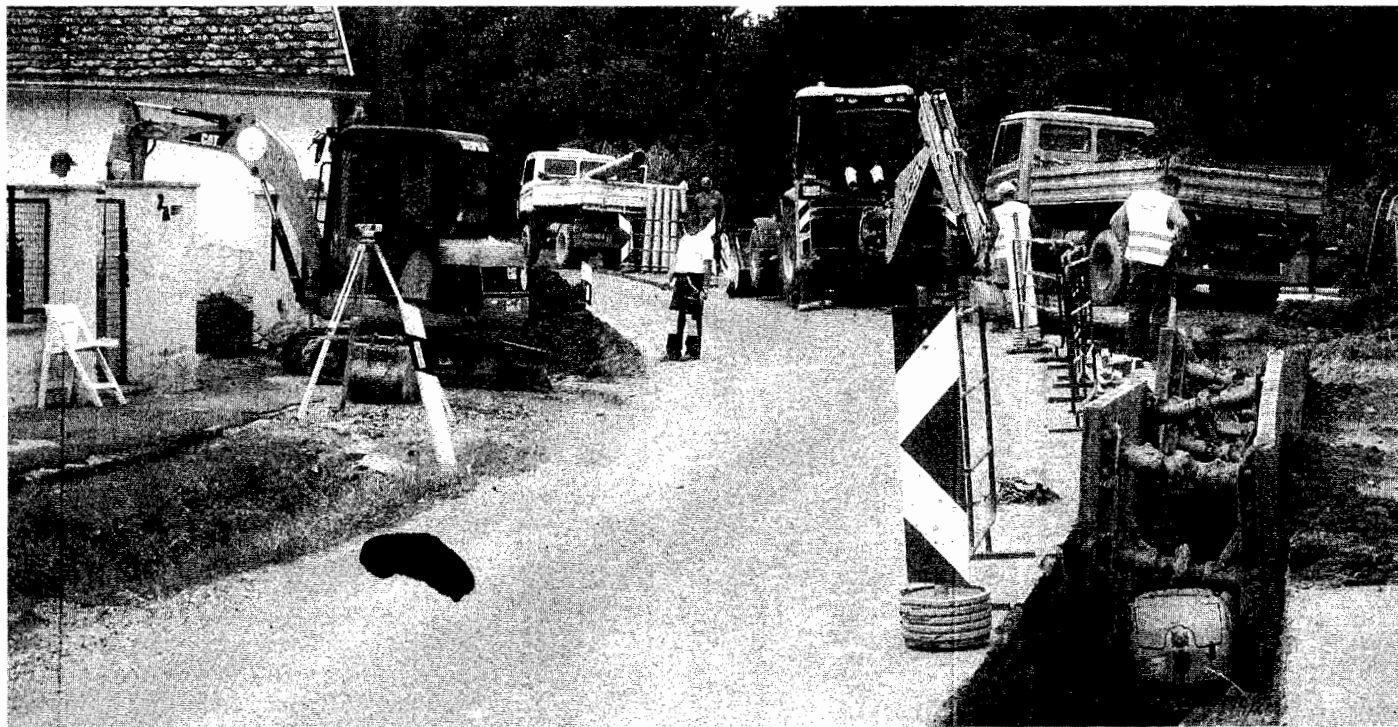
Elérte a szennyvízvezeték Bogád, és készülnek az első házi bekötések, várhatóan jövő tavaszra elkészülnek a munkákkal

FEJLESZTÉSEK Felújítják a volt plébániát – meghosszabbítják a sétányt