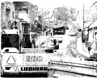
Bogádon 2008-ban készült el a pécsi beruházás részeként az ISPA-vezeték

szennyvízhálózatát, Kozármislyen városa pedig új nyomvezetékét építene. Utóbbi beruházás teljes mértékben önkormányzati önérvél valósul meg, a községekben pedig lakossági hozzájárulás-ru lesz szükség. A pályázat csak bellerülteti csatornázást támogat, eredményét és a támogatás intenzitását várhatóan októberben, az értékelést követően ismerhetik meg. Ekkor tudták pontosabb tájékoztatást adni a lakosság részére a szükséges önérvől összegéről. Ha sikeres lesz a pályázat, Bogád és Romonya az ISPA-tól 2008-ban készült egyik átmenélő, Nagykozár pedig Pécsújhegyen keresztül csatlakozna a megyesszékely meglévő hálózatára.